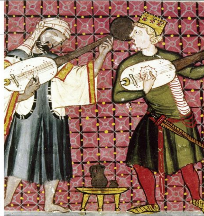
Harmonie Cette enluminure présentant un musulman et un chrétien jouant du luth est extraite de Cantigas de Santa María , un recueil de chansons composé pour Alphonse X de Castille au XIII e siècle (Madrid, bibliothèque de l'Escorial).